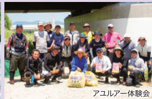
アユルア一体験会